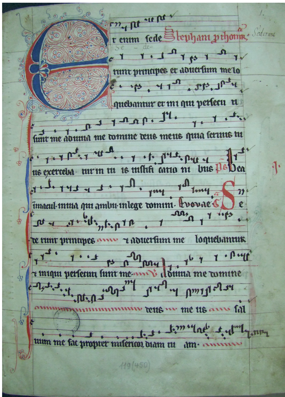
il. 1: Pelplin, Biblioteka Diecezjalna im. Biskupa Jana Bernarda Szlagi, 119 (450), f. 1r.